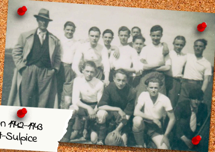
Saison 1942-1943 Saint-Sulpice