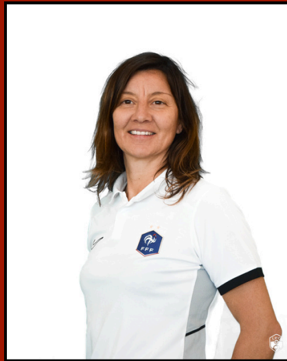
CTR DAP Référente Régional PPF Féminin