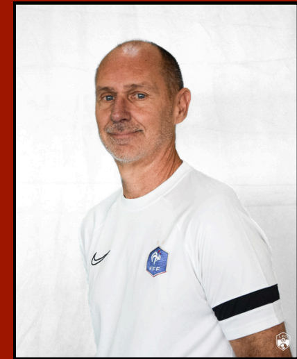
CTR DAP Réfèrent Régional PPF Futsal