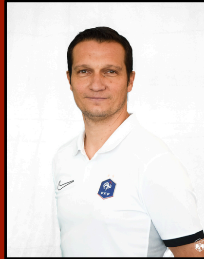
Conseiller Technique Régional PPF